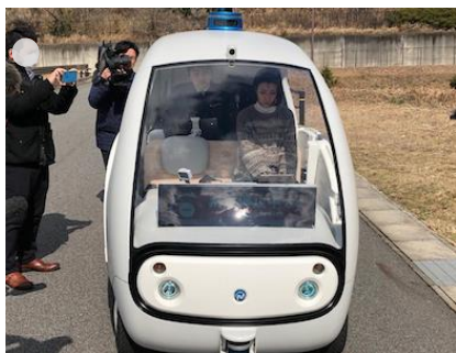
①Milee※ 緊急停止 (愛知県長久手市)