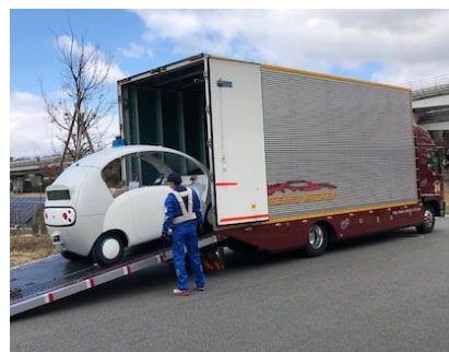
④積載車が Milee※ を搬送