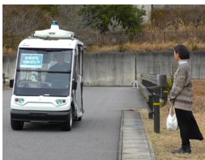
③乗客が代車 (自動運転車) に乗り換え