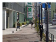
機能1. スマホカメラ映像から視覚情報を取得