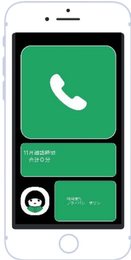
シンプルな操作性