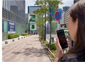
機能1. スマホカメラ映像から視覚情報を取得