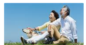
サービスナビゲーター あなたに合うオススメの サービスを紹介

認知機能低下の予防に資する運動や学習、音楽や睡眠のサポートプログラムなどニーズに合わせた幅広いサービスを選んでご利用いただけます。生活習慣や趣味に関する約 20 問の質問から、それぞれのご利用者のニーズに合ったお勧めのサービスをご提案するツール「サービスナビゲーター」をご用意しています。なお、これらの認知機能低下の予防サービスについては、治療行為に該当するものではありません。